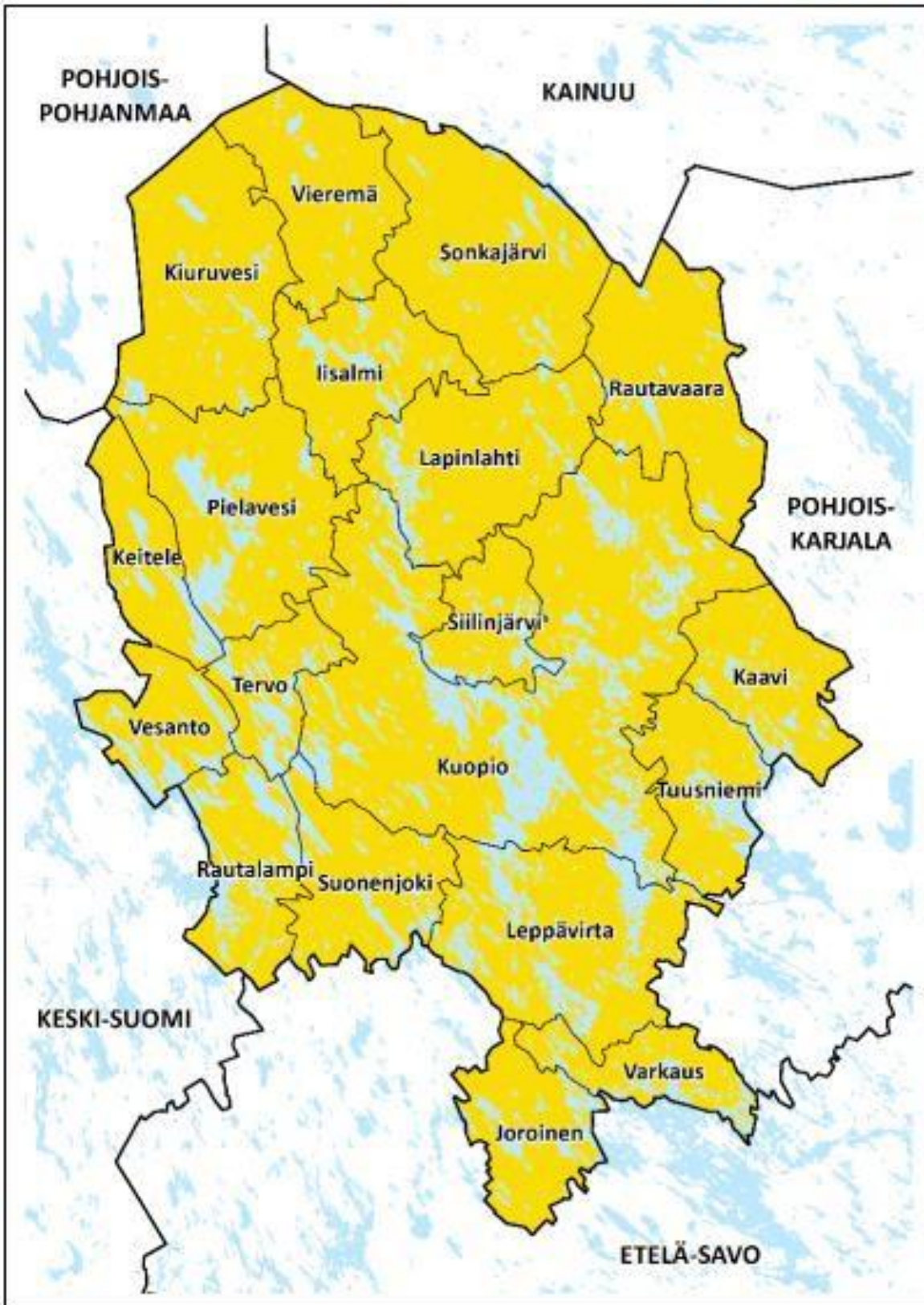
Kuva 1. Pohjois-Savon maakuntakaava 2040, 2. vaiheen suunnittelualue ja ympäröivät maakunnat.